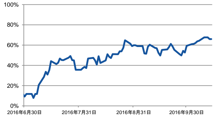
図1: 米国年内利上げ確率

出所:ブルームバーグのデータに基づき当社が作成しております。 期間:2016年6月30日から2016年10月14日までの日次データ。